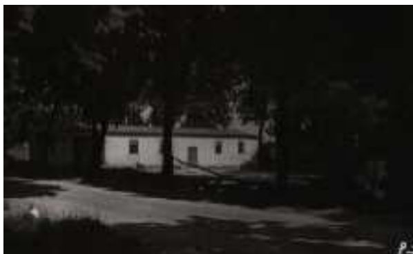
( lokalizacja remizy OSP - 1966 r. )

( budynek Wiejskiego Domu Kultury, wybudowany w 1965 r. Do budynku WDK dobudowano w 2000 roku remizę OSP ).