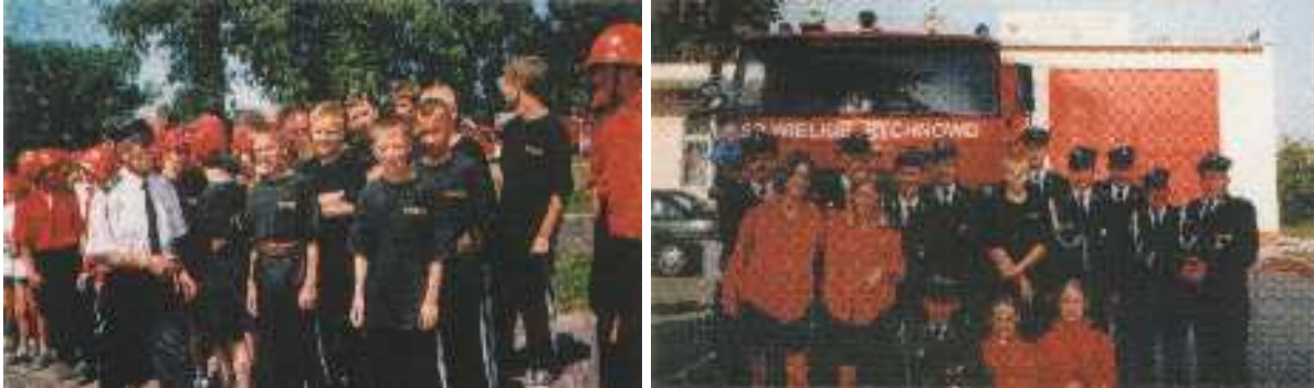
( chłopcy i dziewczęta w szeregach OSP Wielkie Rychnowo )