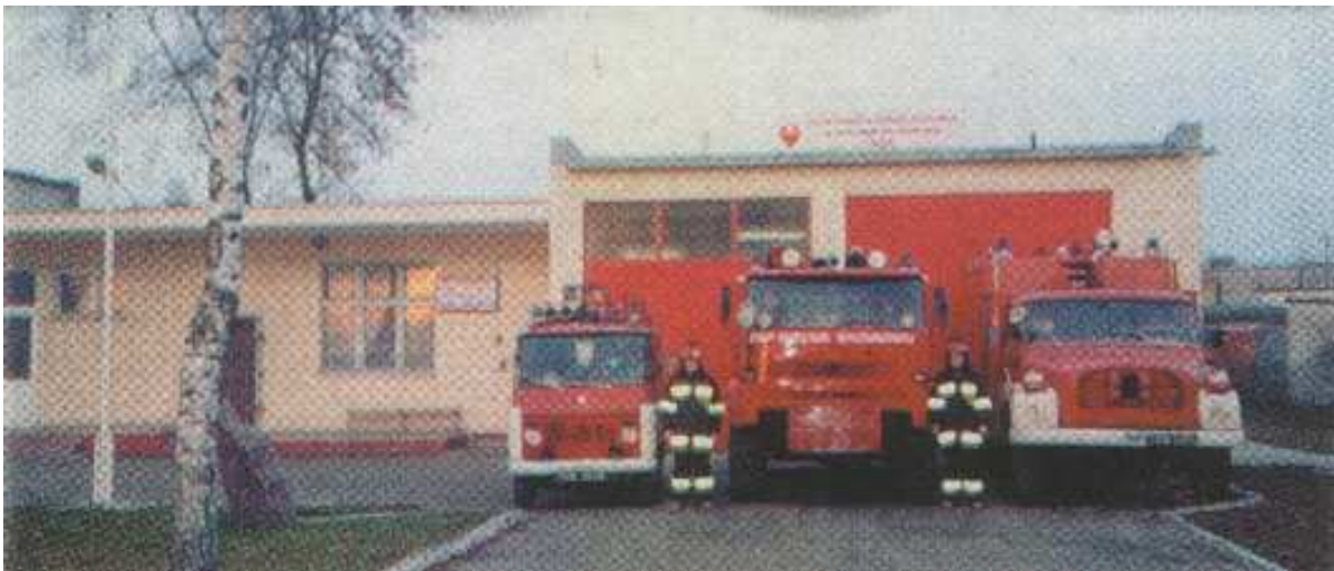
( wybudowana remiza OSP przy budynku WDK )

OSP w Wielkim Rychnowie jest obecnie w posiadaniu dwóch samochodów STARA i TATRY, które zakupione zostały staraniem Zarządu OSP za symboliczne kwoty. Strażacy we własnym zakresie przeprowadzili remonty kapitalne pojazdów, wykorzystując przy tym swoją wiedzę, wyuczone zawody, fachowość. Środki finansowe na zakup samochodów oraz ich wyremontowanie pochodziły z następujących źródeł: funduszy przeznaczonych na działalność, zbiórkę pieniędzy wśród społeczności lokalnej, dobrowolne datki, dofinansowanie pochodzące od sponsorów, sprzedaż kalendarzy, dochody z organizowanych z wielkim powodzeniem festynów. Dziś pojazdy te wyjeżdżają do różnych akcji. Tylko w 2004