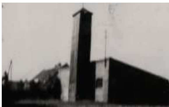
( lokalizacja remizy OSP przed 1964 r. )

Działalność Ochotniczej Straży Pożarnej w Wielkim Rychnowie datowana jest od 1922 roku. Miejsce swojej siedziby zmieniała trzykrotnie, co przedstawiono na zdjęciach poniżej.