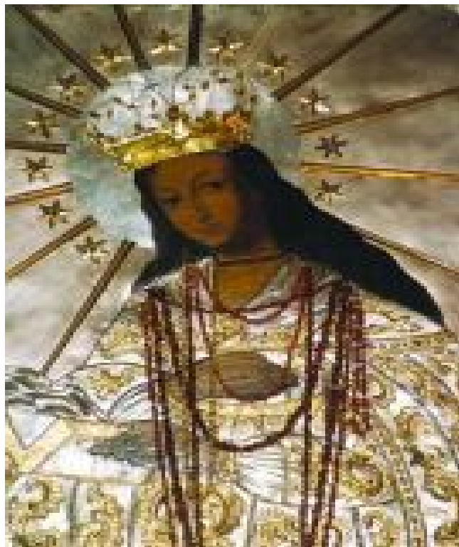
OBRAZ MATKI BOŻEJ BRZEMIENNEJ