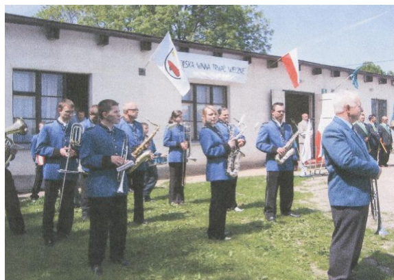
IMPREZA PLENEROWA – CHEŁMONIE 2006 R.