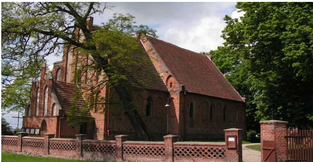
KOŚCIÓŁ P.W. św. BARTŁOMIEJA W CHEŁMONIU