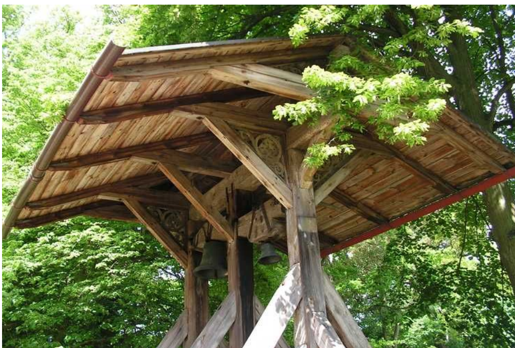
DZWONNICA PRZY KOŚCIELE P.W. św. BARTŁOMIEJA W CHEŁMONIU (DREWNIANA Z 1865 R.)